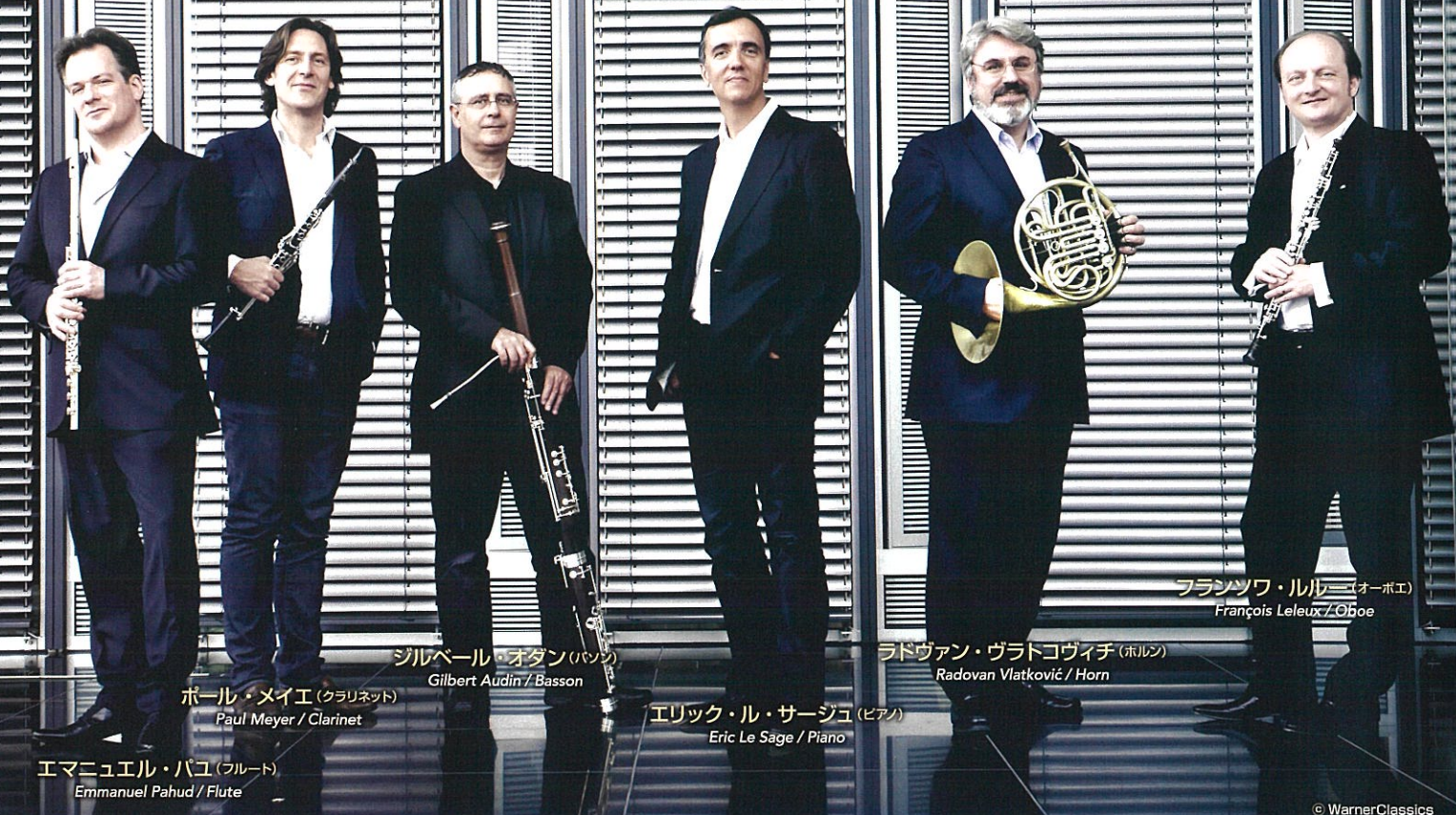
エマニュエル・パユ (フルート) Emmanuel Pahud / Flute